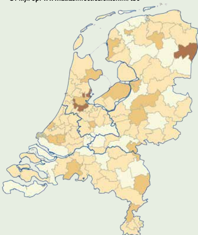
aantal geregistreerde actieve tuberculose (alle vormen) naar maand van diagnose, 2015-2017*, Nederland