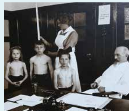
Scholieren op het consultatiebureau

Na twee tbc-uitbraken op scholen treedt de Wet Bescherming Leerlingen tegen Besmettingsgevaar in werking. De wet dwingt personeel van onderwijsinstellingen zich te laten onderzoeken op tuberculose.