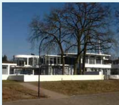
Het markante Zonnestraal-gebouw

Na 23 jaar voorbereiding en fondsenwerving opent in 1928 Sanatorium Zonnestraal de deuren. Nazorg staat centraal. Er zijn werkplaatsen om patiënten te revalideren en weer in het arbeidsproces te krijgen.