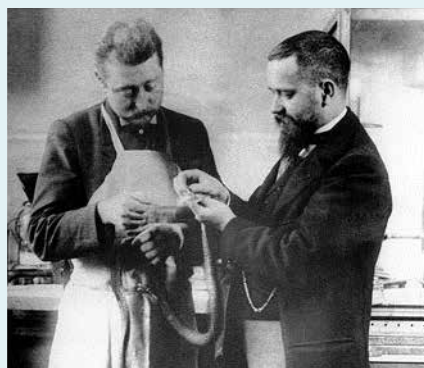
Guérin en Calmette

De Franse bacterioloog Albert Calmette en de dierenarts Camille Guérin slagen erin een vaccin te maken. De Bacillus Calmette-Guérin (BCG) redt veel kinderen, maar blijkt niet effectief genoeg om tuberculose te elimineren.