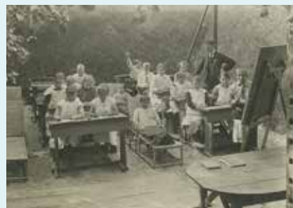
Eerste Buitenschool in Den Haag

In Den Haag verrijst vlakbij zee de Eerste Nederlandse Buitenschool als herstellingsoord voor kinderen met tuberculose – een sober, maar licht en gezond gebouw met veel openslaande ramen, nu een rijksmonument.